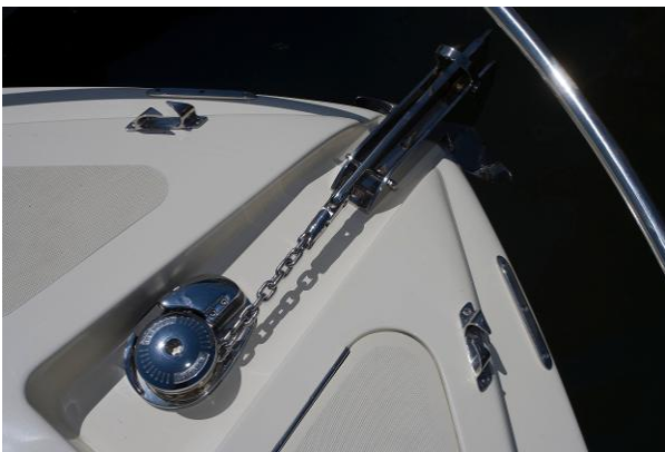
Guindeau électrique 1000W avec davier inox