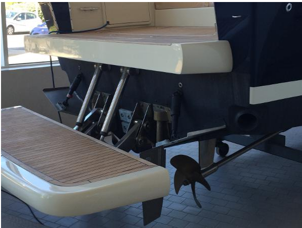
Plate forme de bain hydraulique