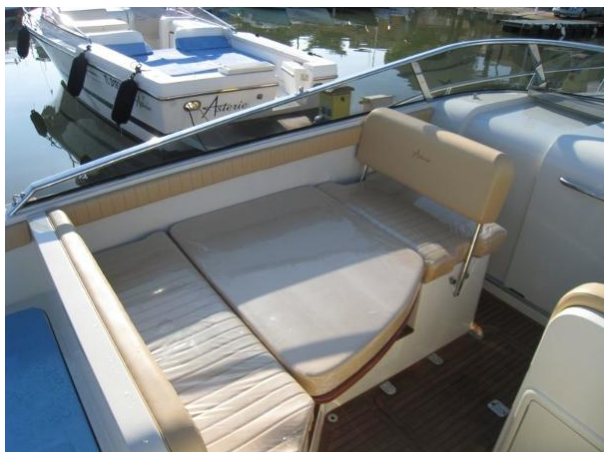
Table extérieure version bain de soleil avec coussin