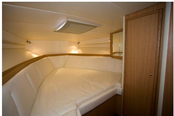
Cabine deux couchages avec penderie et placards de rangement