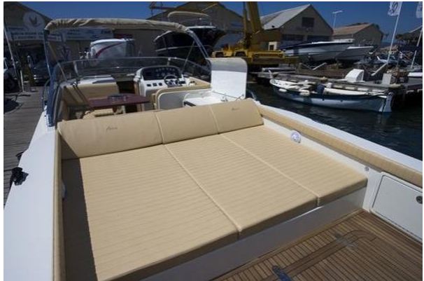
Bain de soleil cockpit arrière