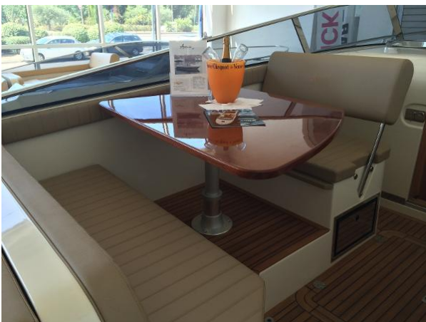
Table sur pied électrique dans cockpit extérieur