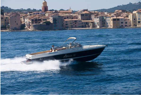
Asterie 40' version day cruiser-photo non contractuelle