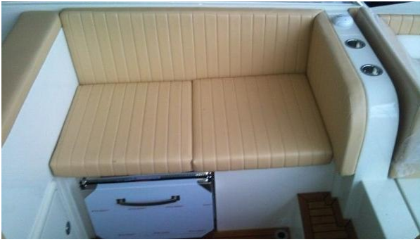
Option banquette deux personnes cockpit extérieur