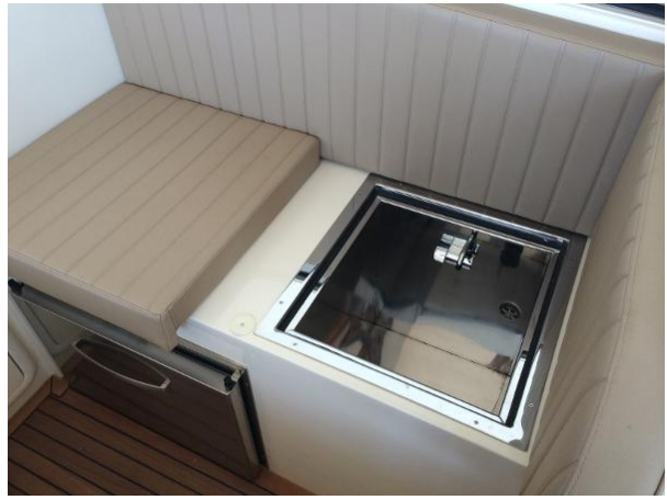
Option banquette avec lavabo intégré et tiroir frigo