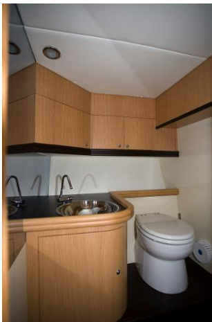
Cabinet de toilette indépendant avec douche